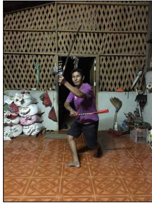
ภาพที่ 1 ท่วงท่าลายต่อสู้อู้อู เรียกว่า ลายพิน

ลักษณะที่ 2 กำมือ เป็นรูปแบบของการฟ้อนเพื่อให้เกิดความสวยงามอ่อนช้อย ใช้สำหรับฟ้อนต้อนรับแขกบ้านแขกเมือง ท่วงท่าลีลา เรียกว่า ลายพอน ดังภาพประกอบด้านล่าง